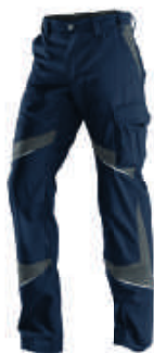
Dunkelblau | Anthrazit 2550 5365-4897 D34-D54