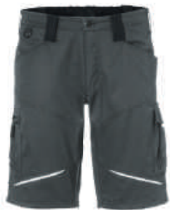
Anthrazit 2950 5231-97 40-64