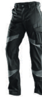
Schwarz | Anthrazit 2550 5365-9997 D34-D54