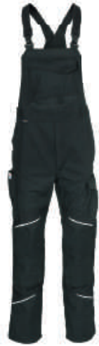
Schwarz 3450 3421-99 40-66, 90-118, 23-31