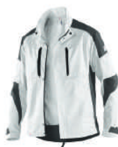
Weiß | Anthrazit 1250 5365-1097 XS-4XL