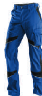
Kbl.blau | Schwarz 2550 5365-4699 D34-D54