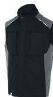
Schwarz | Anthrazit 7250 5365-9997 XS-4XL