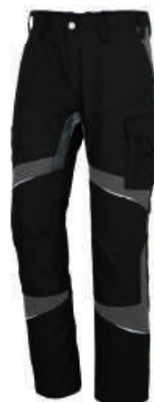
Schwarz | Anthrazit 2150 5365-9997 40-66, 90-118, 25-31