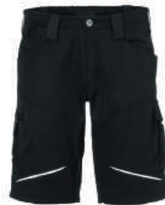
Schwarz 2950 5231-99 40-64