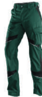
Moosgrün | Schwarz 2550 5365-6599 D34-D54