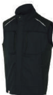
Schwarz 7250 5365-99 XS-4XL