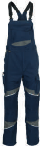
Dunkelblau | Anthrazit 3450 3421-4897 40-66, 90-118, 23-31