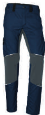
Dunkelblau | Anthrazit 2850 5231-4897 40-66, 90-118, 23-31