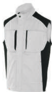
Weiß | Anthrazit 7250 5365-1097 XS-4XL