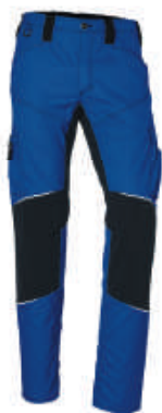
Kbl.blau | Schwarz 2850 5231-4699 40-66, 90-118, 23-31