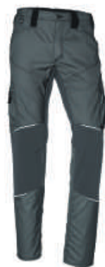
Anthrazit 2850 5231-97 40-66, 90-118, 23-31