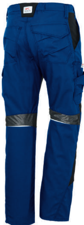
Kbl.blau | Schwarz 2150 5365-4699 40-66, 90-118, 25-31