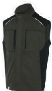
Oliv | Schwarz 7250 5365-6699 XS-4XL