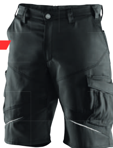
Schwarz 2650 5365-99 D34-D54