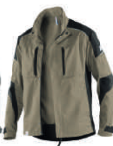
Sandbraun | Schwarz 1250 5365-2599 XS-4XL