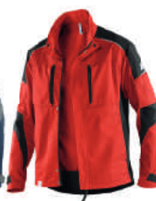
Mittelrot | Schwarz 1250 5365-5599 XS-4XL