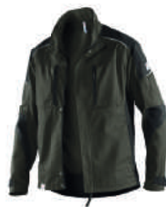
Oliv | Schwarz 1250 5365-6699 XS-4XL