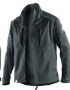
Anthrazit 1250 5365-97 XS-4XL