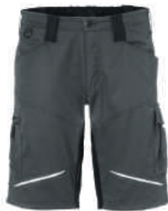
Anthrazit | Schwarz 2950 5231-9799 40-64