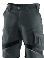
Anthrazit | Schwarz 2450 5365-9799 40-66