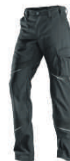
Schwarz 2550 5365-99 D34-D54