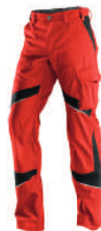
Mittelrot | Schwarz 2550 5365-5599 D34-D54