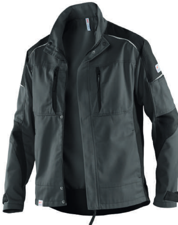
Anthrazit | Schwarz 1250 5365-9799 XS-4XL