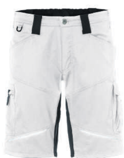
Weiß | Anthrazit 2950 5231-1097 40-64