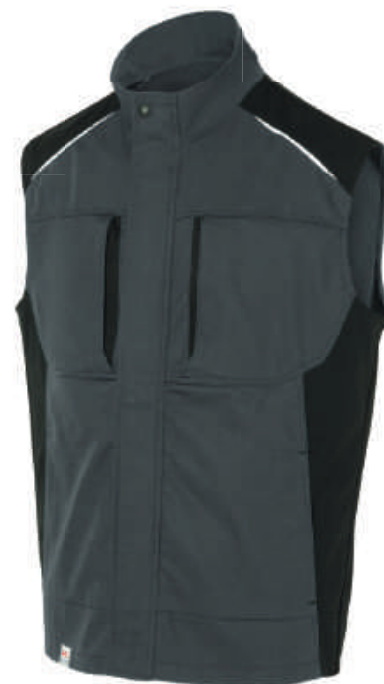
Anthrazit | Schwarz 7250 5365-9799 XS-4XL