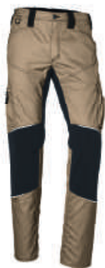
Sandbraun | Schwarz 2850 5231-2599 40-66, 90-118, 23-31