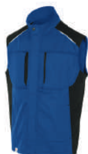
Kbl.blau | Schwarz 7250 5365-4699 XS-4XL