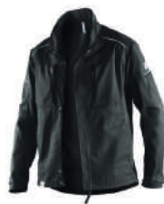
Schwarz 1250 5365-99 XS-4XL