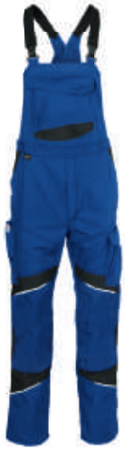
Kbl.blau | Schwarz 3450 3421-4699 40-66, 90-118, 23-31