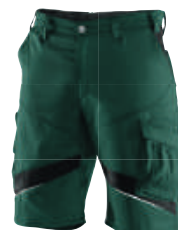
Moosgrün | Schwarz 2450 5365-6599 40-66