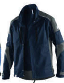
Dunkelblau | Anthrazit 1250 5365-4897 XS-4XL