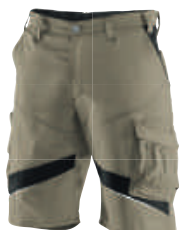
Sandbraun | Schwarz 2450 5365-2599 40-66