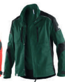
Moosgrün | Schwarz 1250 5365-6599 XS-4XL