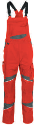
Mittelrot | Anthrazit 3450 3421-5597 40-66, 90-118, 23-31