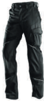
Anthrazit 2550 5365-97 D34-D54