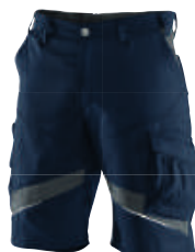
Dunkelblau | Anthrazit 2450 5365-4897 40-66