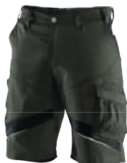
Oliv | Schwarz 2450 5365-6699 40-66