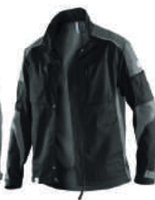
Schwarz | Anthrazit 1250 5365-9997 XS-4XL