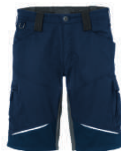
Dunkelblau | Anthrazit 2950 5231-4897 40-64