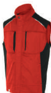
Mittelrot | Schwarz 7250 5365-5599 XS-4XL