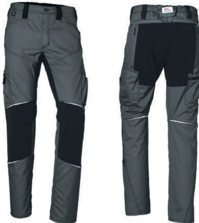
Anthrazit | Schwarz 2850 5231-9799 40-66, 90-118, 23-31