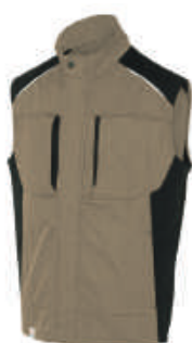
Sandbraun | Schwarz 7250 5365-2599 XS-4XL