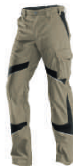
Sandbraun | Schwarz 2550 5365-2599 D34-D54