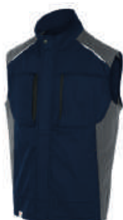
Dunkelblau | Anthrazit 7250 5365-4897 XS-4XL