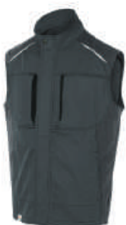
Anthrazit 7250 5365-97 XS-4XL