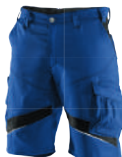
Kbl.blau | Schwarz 2450 5365-4699 40-66