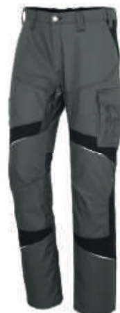
Anthrazit | Schwarz 2150 5365-9799 40-66, 90-118, 25-31