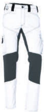
Weiß | Anthrazit 2850 5231-1097 40-66, 90-118, 23-31