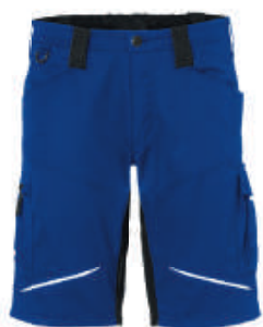
Kbl.blau | Schwarz 2950 5231-4699 40-64