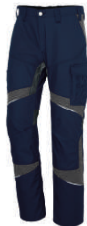
Dunkelblau | Anthrazit 2150 5365-4897 40-66, 90-118, 25-31