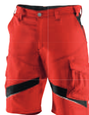
Mittelrot | Schwarz 2450 5365-5599 40-66