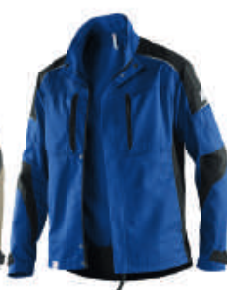
Kbl.blau | Schwarz 1250 5365-4699 XS-4XL