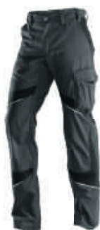
Anthrazit | Schwarz 2550 5365-9799 D34-D54