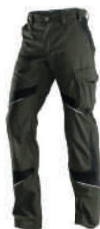
Oliv | Schwarz 2550 5365-6699 D34-D54