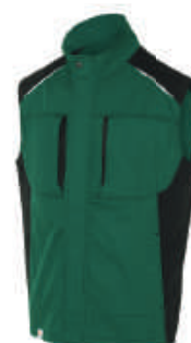
Moosgrün | Schwarz 7250 5365-6599 XS-4XL