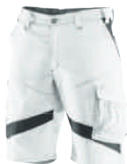
Weiß | Anthrazit 2450 5365-1097 40-66