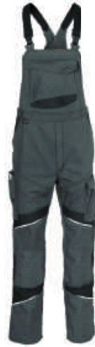
Anthrazit | Schwarz 3450 3421-9799 40-66, 90-118, 23-31