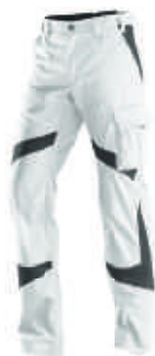
Weiß | Anthrazit 2550 5365-1097 D34-D54