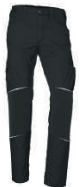
Schwarz 2850 5231-99 40-66, 90-118, 23-31