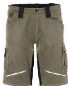
Sandbraun | Schwarz 2950 5231-2599 40-64