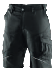
Schwarz 2450 5365-99 40-66