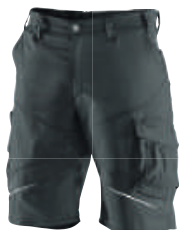
Anthrazit 2450 5365-97 40-66