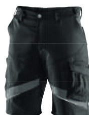
Schwarz | Anthrazit 2450 5365-9997 40-66